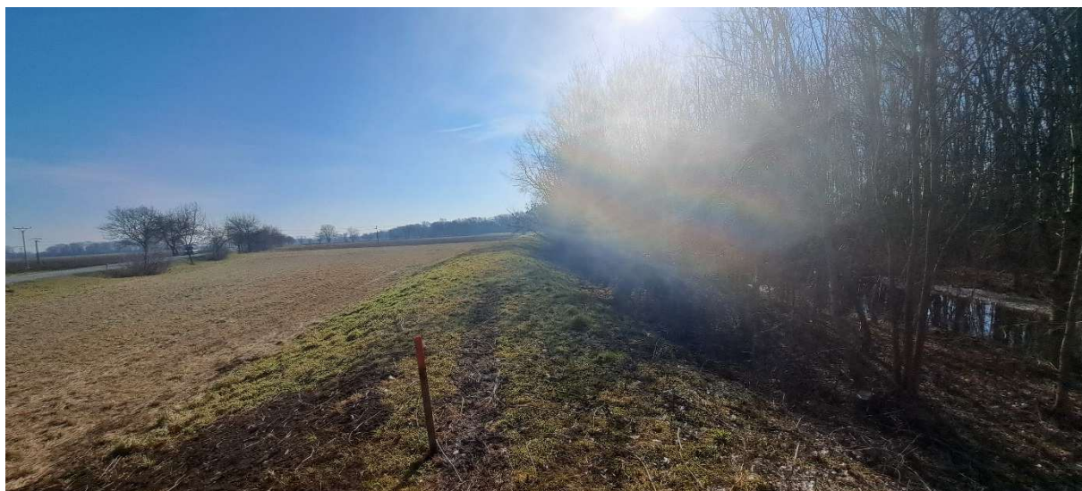
3. SO 01 – pohled na konec úseku