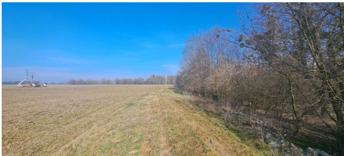
5. SO 02 – pohled na začátek úseku