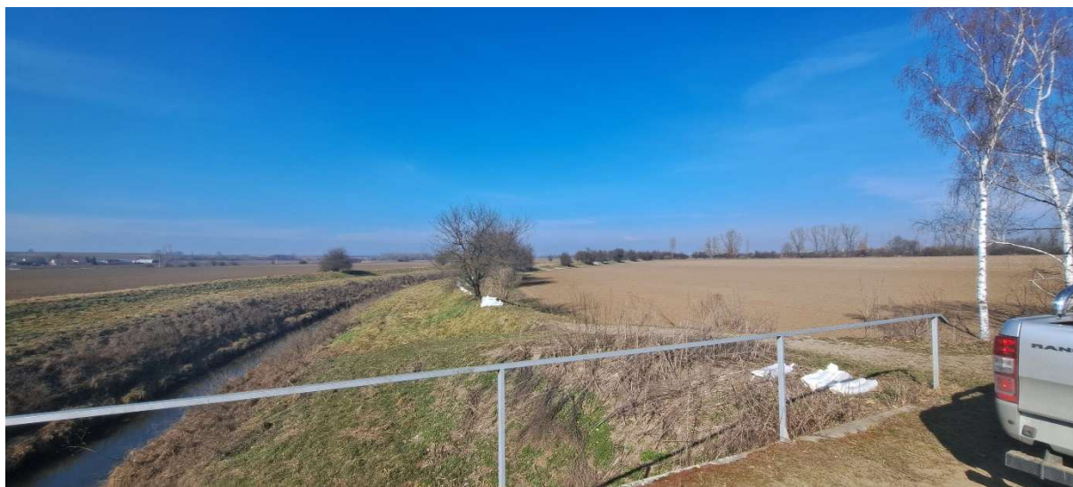
8. SO 03 – pohled od příjezdové komunikace a mostu