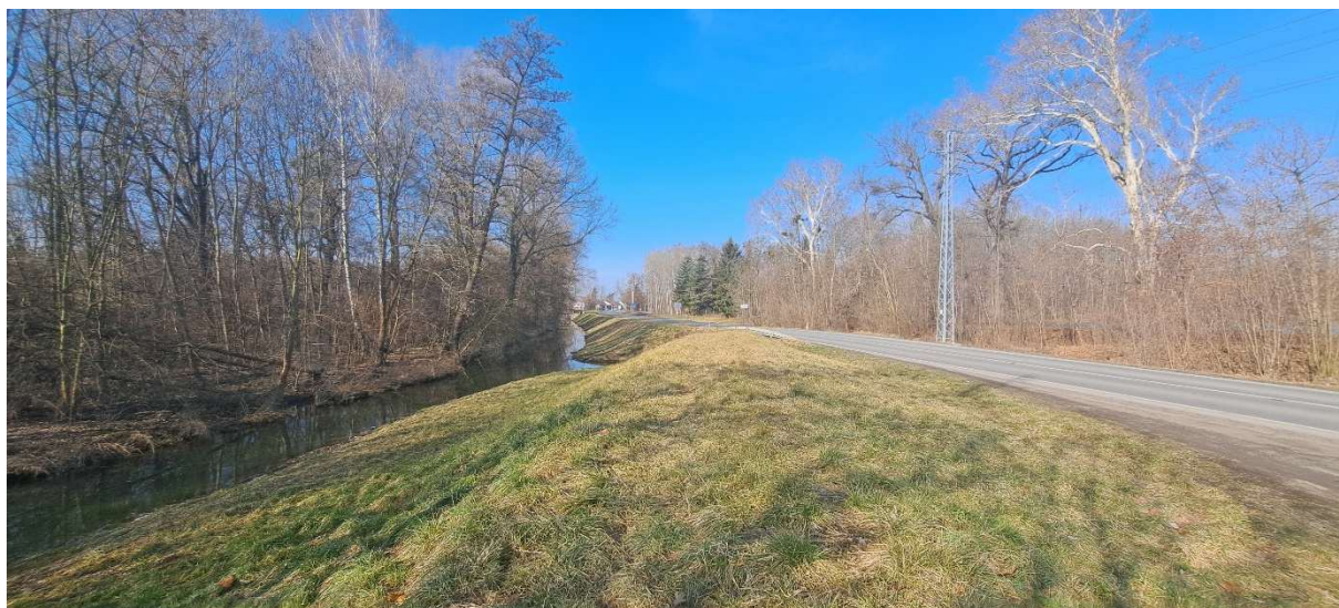
1. SO 01 – pohled na začátek řešeného úseku