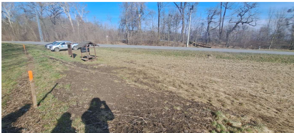
2. SO 01 – pohled na úsek nové homogenní ochranné hráze + prostor zařízení staveniště