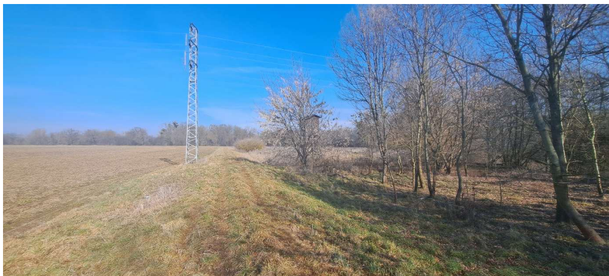
6. SO 02 – pohled na konec úseku