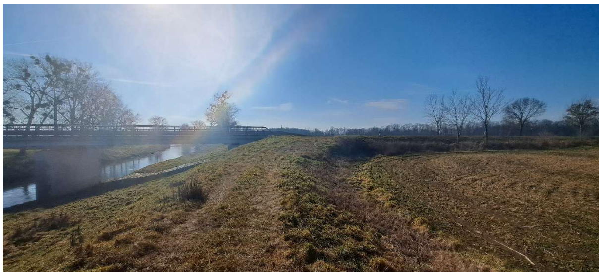
4. SO 02 – pohled od začátku úseku k přístupové hrázi